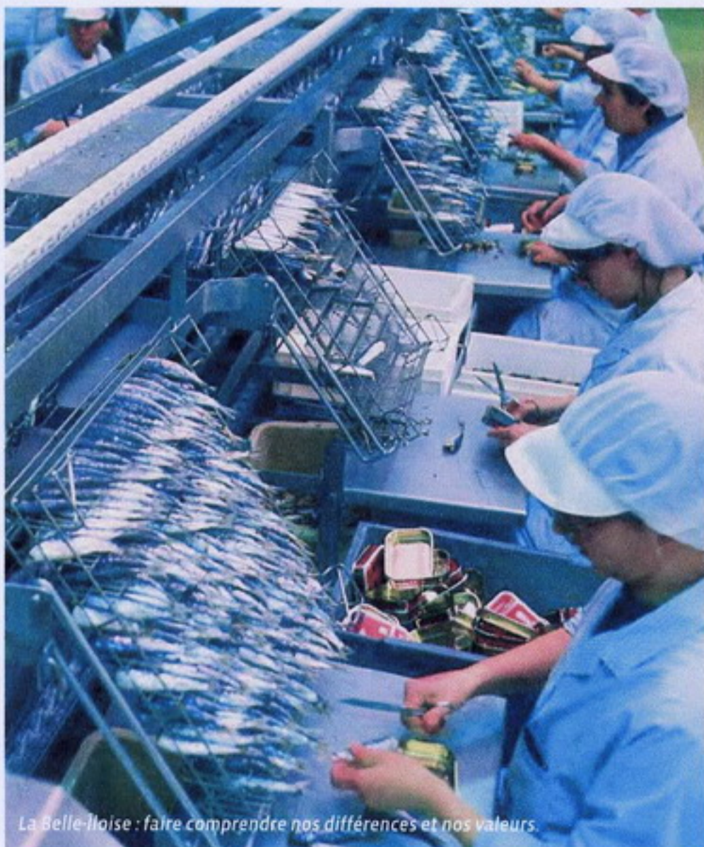
La Belle-Îloise : faire comprendre nos différences et nos valeurs.